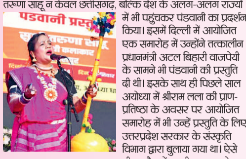
और मोपाल, उड़ीसा के अलावा अलवर राजस्थान में भी वे पंडवानी