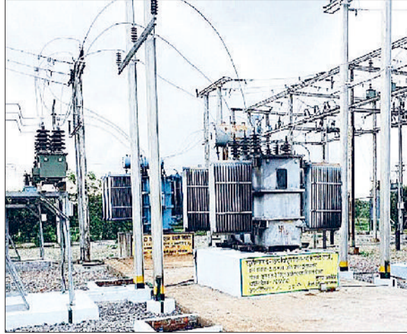
जिले के 30 हजार किसानों-उपभोक्ताओं को मिलेगा लाभ